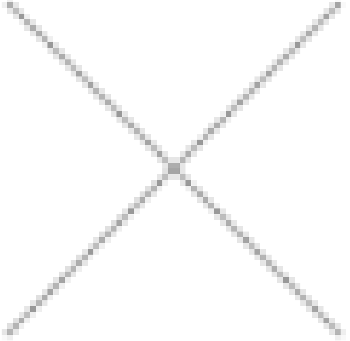
Image not readable or empty /home/mcxsd05/domains/heritage-mercury.net/public_html/base/components/com_rsform/uploads/5742de27f346b-1.